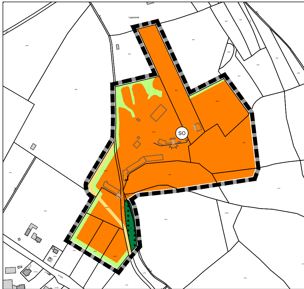
Änderungsplan M 1: 5.000